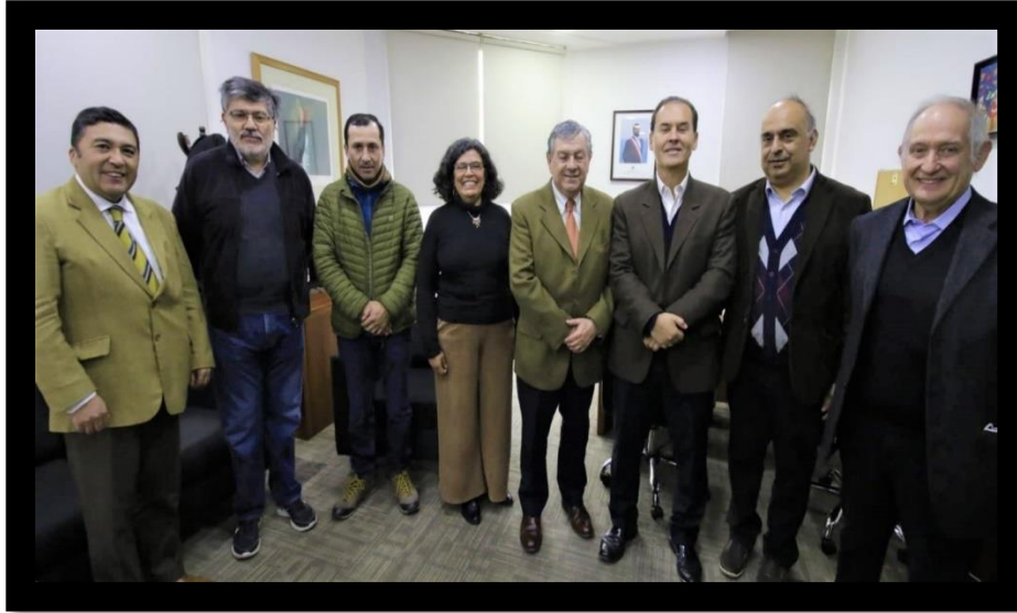
Integrantes del Consejo Consultivo junto al Subsecretario de Previsión Social, Jefe de Asesoría Legislativa de la Subsecretaría de Previsión Social y el Jefe de Proyectos de GSE Consultores.