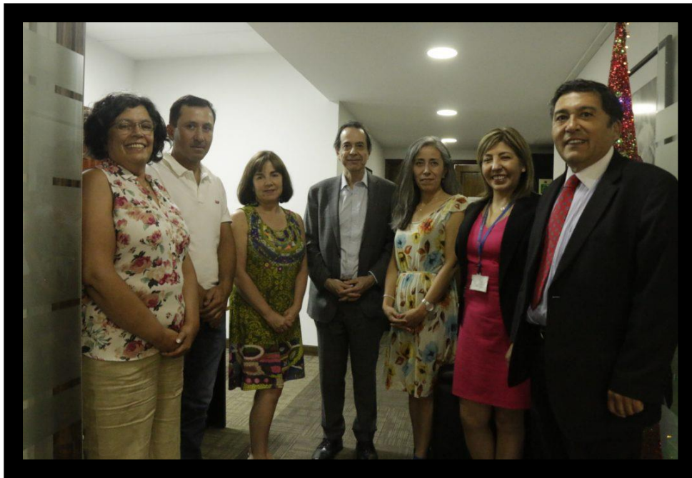
Integrantes del Consejo Consultivo junto al Subsecretario de Previsión Social, Superintendente de Seguridad Social y profesional de la SUSESO.

En la sesión la Superintendente de Seguridad Social abordó los temas de accidentes del trabajo graves y fatales y expuso sobre la forma como se implementaría el nuevo Cuestionario CEAL-SM/SUSESO.