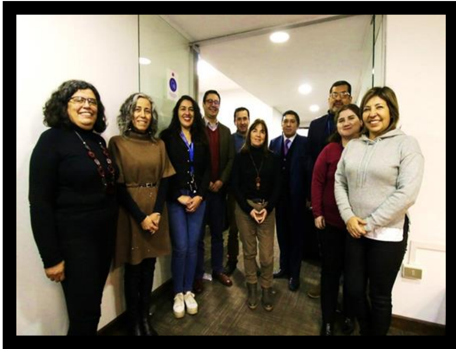
Integrantes del Consejo Consultivo junto Representantes de la SUSESO, CONASET y Dirección del Trabajo.