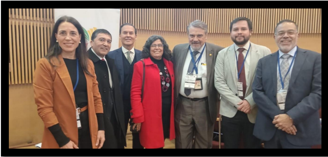
Integrantes del Consejo Consultivo junto representantes de México, Perú y Uruguay