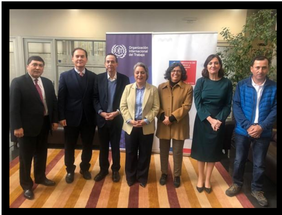
Integrantes del Consejo Consultivo junto Ministra del Trabajo, Subsecretario de Previsión Social y Especialista OIT en SST.

El 28 de abril del presente año, los representantes del Consejo Consultivo participaron en la ceremonia de conmemoración del día mundial de la seguridad y salud en el trabajo, realizada en dependencia de la OIT para el Cono Sur de América Latina.